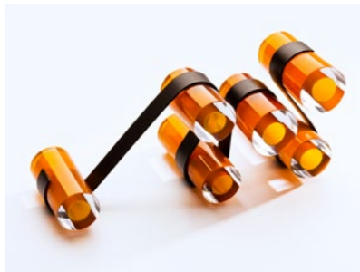
Mechanical Processing, 2013