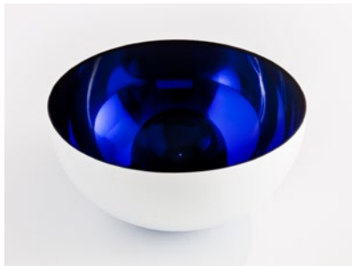
Hemisphere Counterpart, 2013