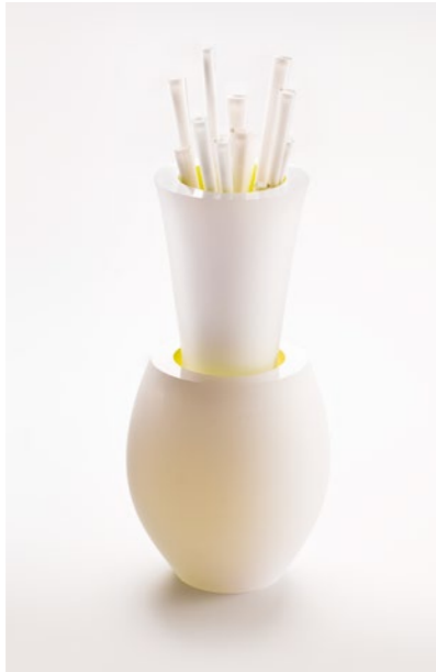
Painters Block, 2013