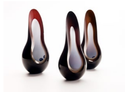
Thought Catchers, 2013