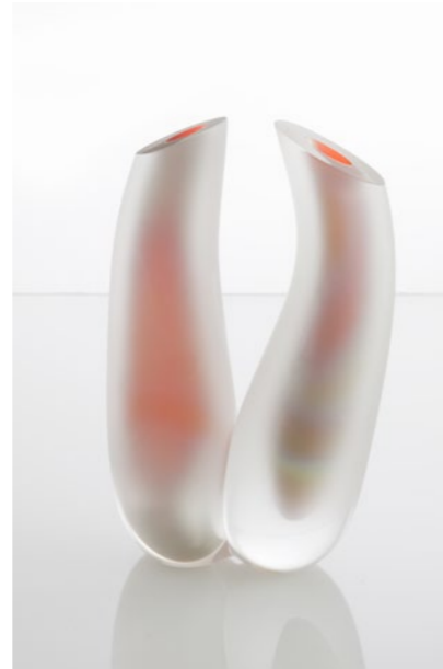
Soft Balance, 2011