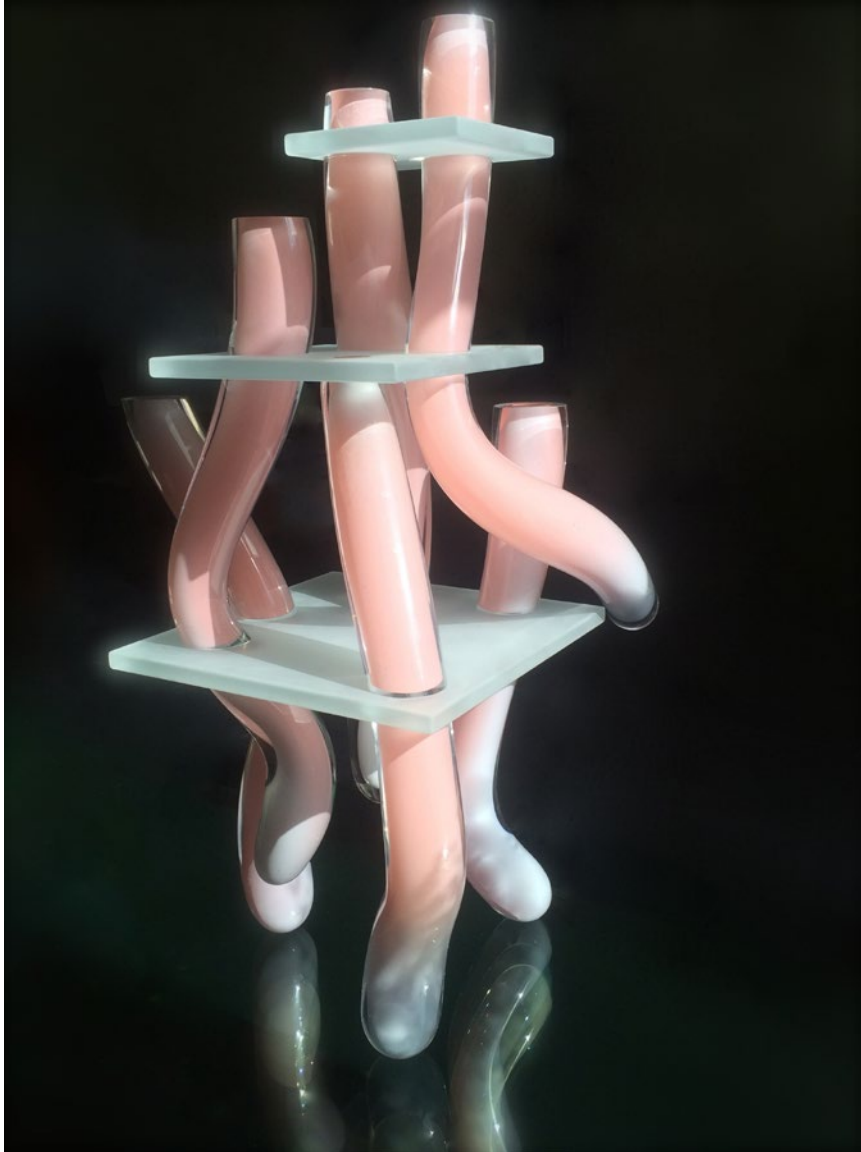
Functionalism Taken Further, 2016