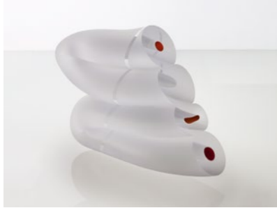
Balanced Movement, 2011