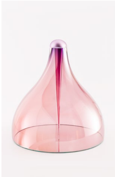
Echo of Infinity, 2013