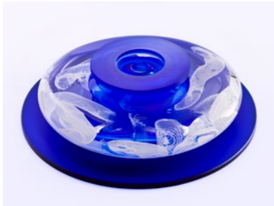
Amorphous Perspective, 2013