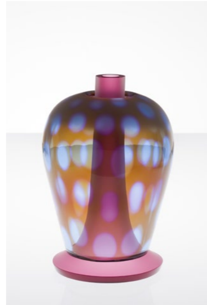
Anemone Trumpet, 2009