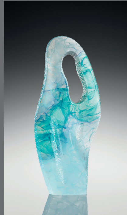
Seaforms #411, 2023 - 53 x 24 x 12 cm glas, smelttechniek, geslepen en gepolijst