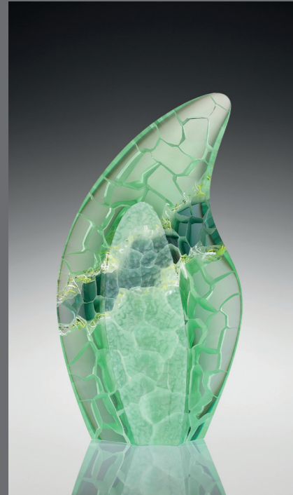
Seaforms #426, 2024 - 43 x 23 x 11 cm glas, smelttechniek, geslepen en gepolijst

Vrijdag, zaterdag en zondag 13.00 -17.00 uur Gesloten zaterdag 27 april Koningsdag