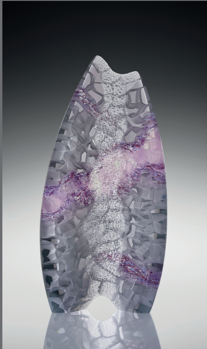
Seaforms #401, 2023 - 73 x 35 x 14 cm glas, smelttechniek, geslepen en gepolijst