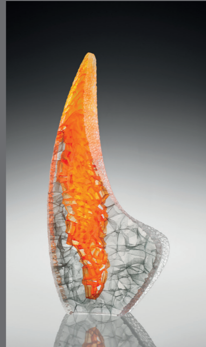
Seaforms #405, 2023 - 81 x 38 x 14 cm glas, smelttechniek, geslepen en gepolijst