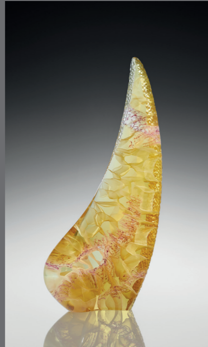
Seaforms #396, 2023 - 61 x 28 x 13 cm glas, smelttechniek, geslepen en gepolijst