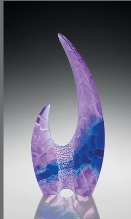
Seaforms #423, 2024 - 47 x 22 x 10 cm glas, smelttechniek, geslepen en gepolijst