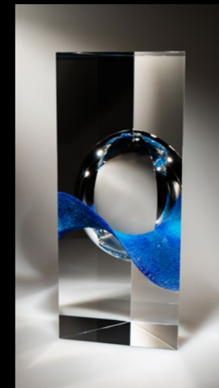
Montgolfiera 2024 16x13x36cm

Andrej Jakab Foto cover: Birds 2024 19x9x27cm