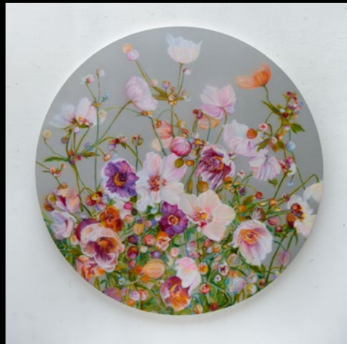
Silver Nemorosa 2024 ø180cm