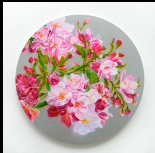
Pink Sakura Silver 2024 ø180cm