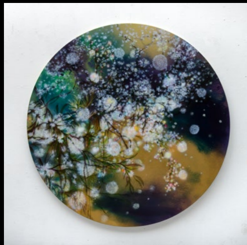
Flower Pollen II 2024 ø180cm