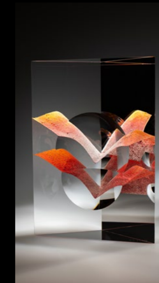
Birds 2024 19x9x27cm