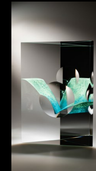
Bird 2024 19x9x27cm