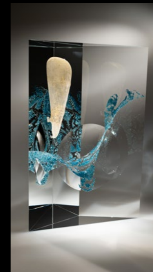
Bird 2024 25x9x37cm