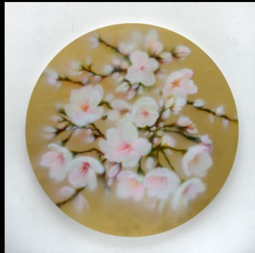
Golden Sakura 2024 ø180cm