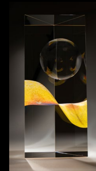
Levitation 2024 16x13x37cm