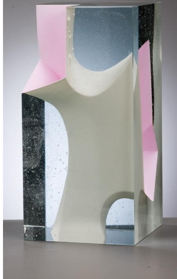
FATHOM, 2010 Crystal glass, 40 cm hoog