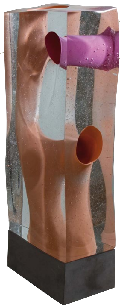
WEINIG MEELEVEN, 2010 Crystal glass on blue stone base, 120 cm hoog