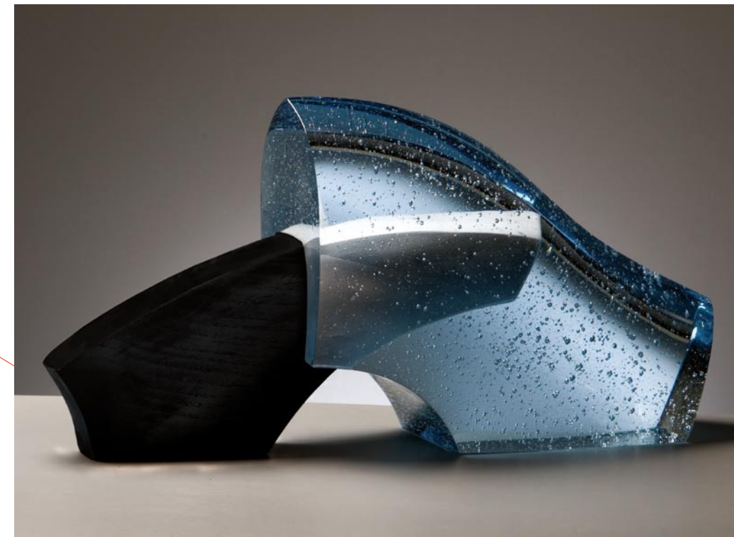
BERICHTEN UIT EEN VOORTIJD, 2010