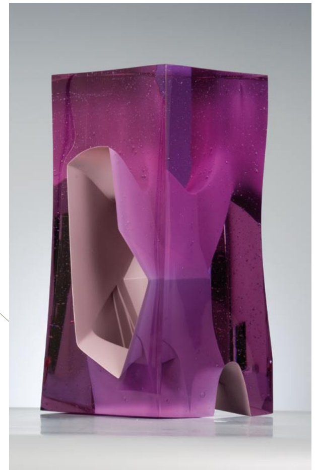
MESOCOSM I, 2010 Crystal glass, 27 cm hoog