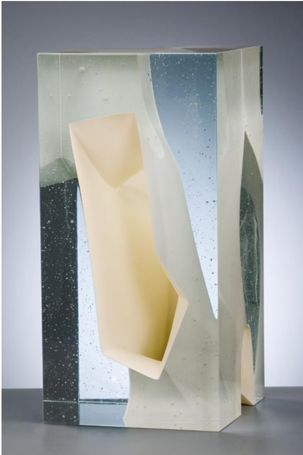
MESOCOSM IV, 2010 Crystal glass, 40 cm hoog