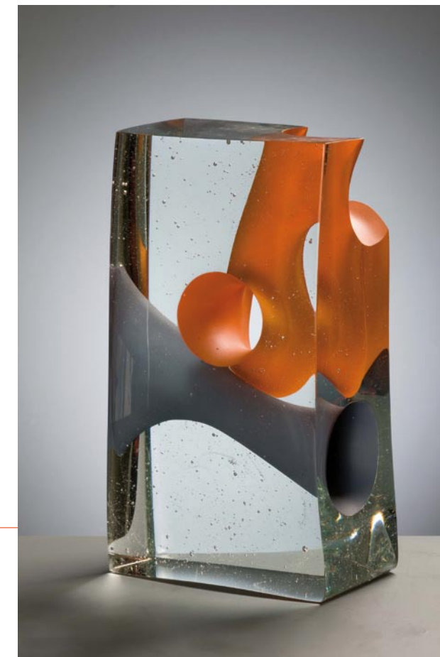
DE GOLFTIJD, 2010 Crystal glass, 27 cm hoog