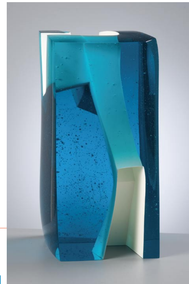
MESOCOSM II, 2010 Glass 403, 40 cm hoog

Het vertrekpunt bij het werken met glas is vaak diezelfde lichtbron. Deze geeft leven aan de raadselachtige kleurencombinaties van glas. Glasobjecten zijn tegelijkertijd ontvanger en zender van licht. De vormtaal van de objecten, met de suggestie van bewegingen in de vrije ruimte, voegt er een extra dimensie aan toe: de breking van het licht.