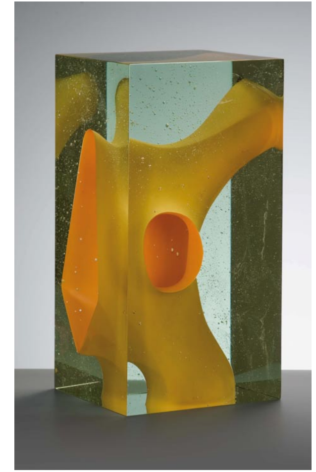
DE TIJDSTROOM, 2009 Crystal glass, 40 cm hoog