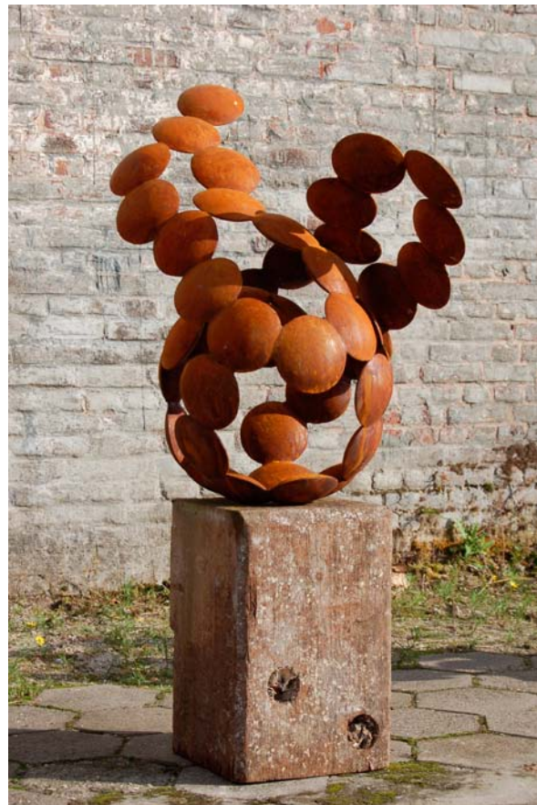
UMULONIMBUS, CALVUS, 2010 Cortenstaal, hardhout, 125 x 60 x 50 cm