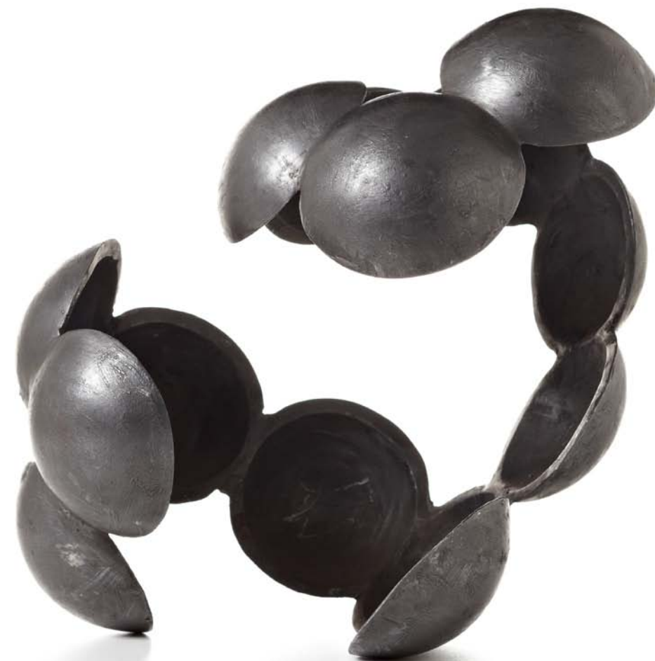
CIRROCUMULUS, INCUS, 2010 Staal, grafiet, 30 x 35 x 25 cm

“DOOR HET SOMS FYSIEK ZWARE EN TIJDROVENDE AMBACHT KRIJG IK DE GELEGENHEID OM HELEMAAL IN DE SCULPTUUR TE KOMEN EN LAAT IK, TEGELIJKERTIJD, DE SCULPTUUR HELEMAAL IN MIJ KOMEN. VOORAL TIJDENS HET LANGDURIG POLIJSTEN VAN HET STAAL KRIJG IK NIEUWE IDEEËN VOOR VOLGENDE WERKEN. DIE WISSELWERKING HEEFT VOOR MIJ IETS VAN DE MAGIE VAN WATER: VAN BUITENAF ERGENS OP INWERKEN EN TOT LEVEN BRENGEN, DOET VAN BINNENUIT IETS NIEUWS WELLEN EN GROEIEN.”