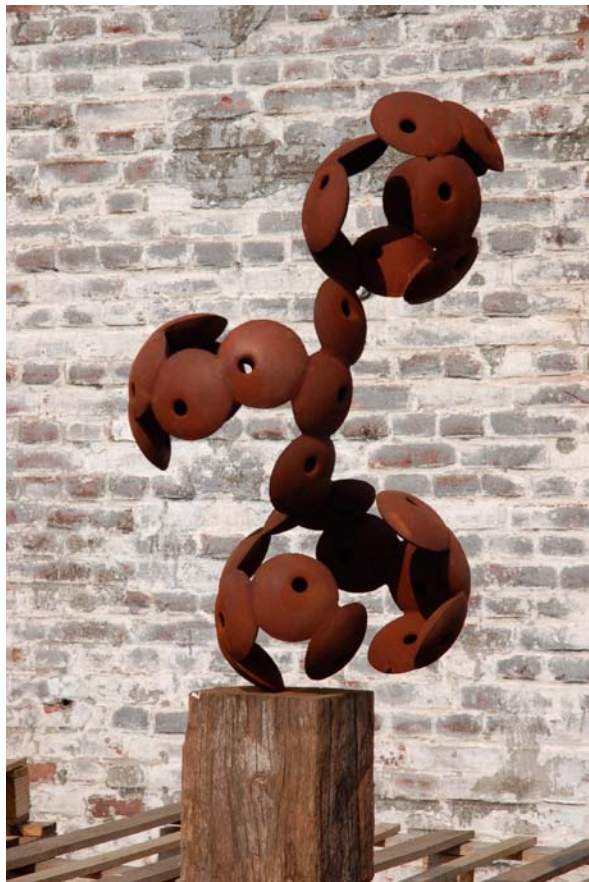
LACUNUSUS, ALTUS, 2010 Cortenstaal, hardhout, 40 x 55 x 87 cm