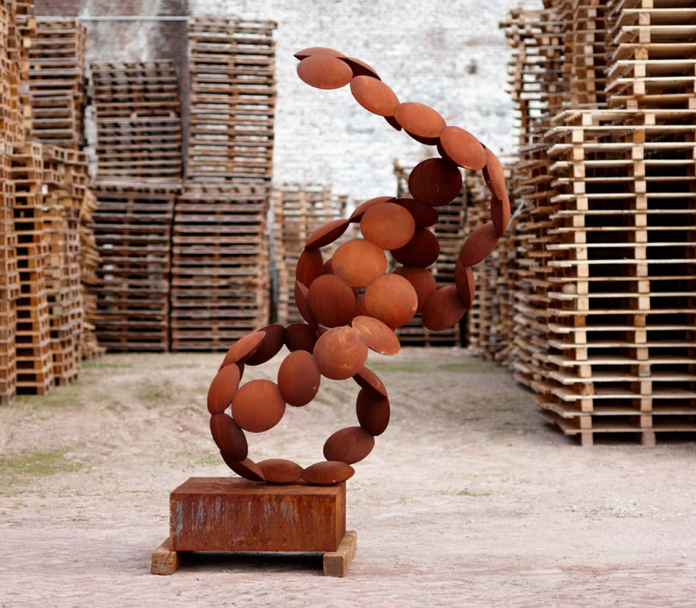
CIRROCUMULUS, 2010 Cortenstaal, 200 x 130 x 140 cm