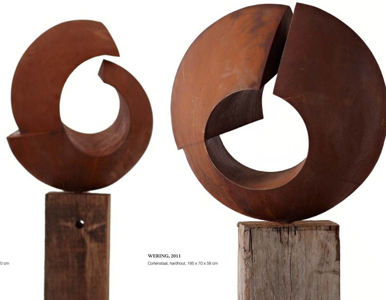
DOORZICHT, 2011 Cortenstaal, hardhout, 175 x 60 x 70 cm