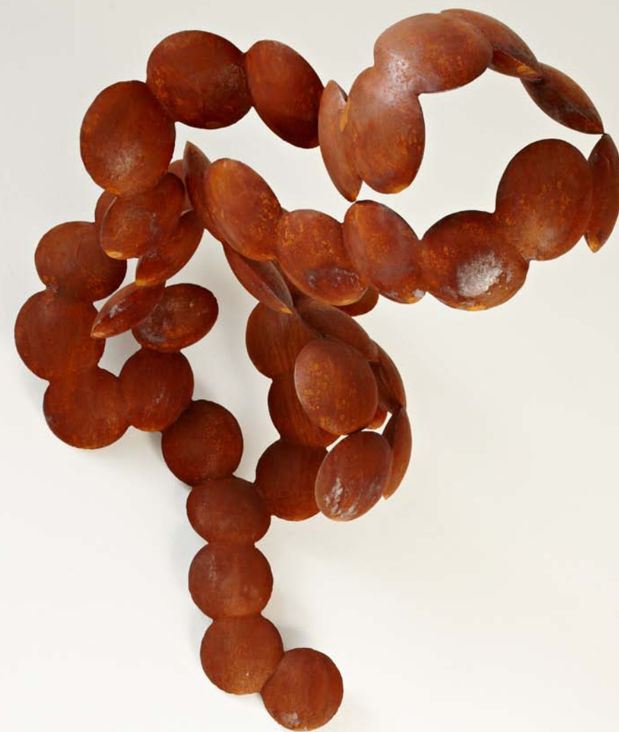
ALTOCUMULUS, 2010 Wandsculptuur, cortenstaal, 80 x 80 x 50 cm