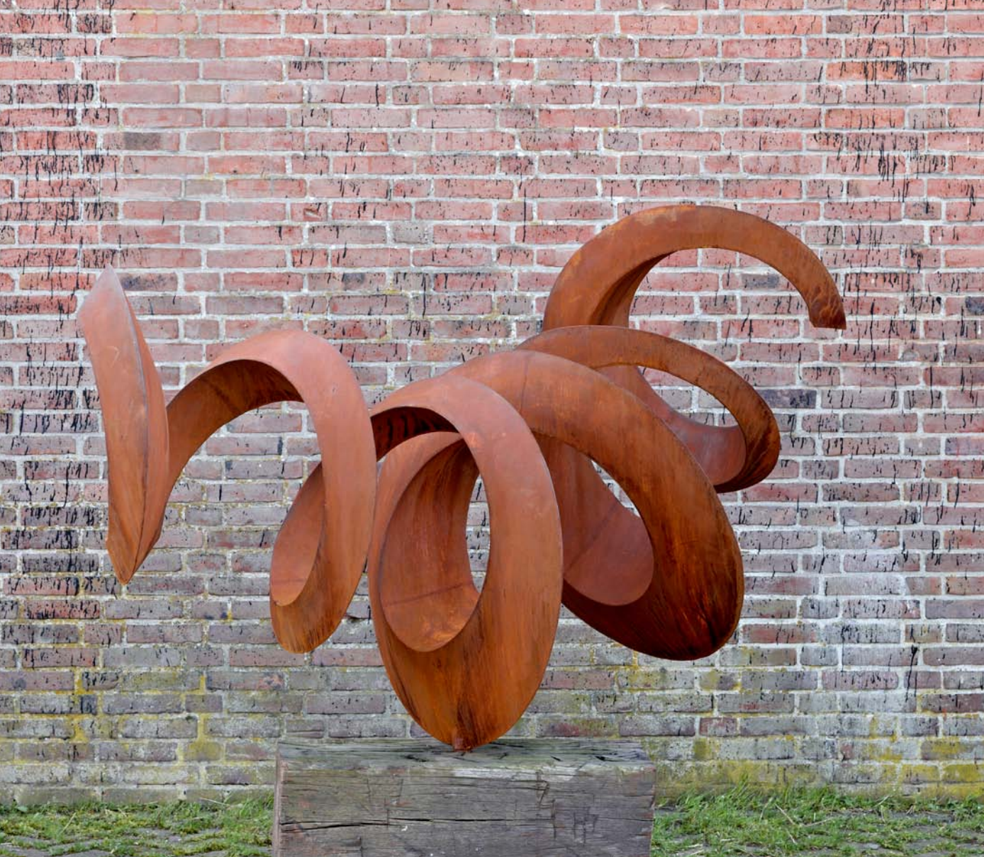
OPWAARTS, 2011 Cortenstaal, hardhout, 210 x 90 x 160 cm