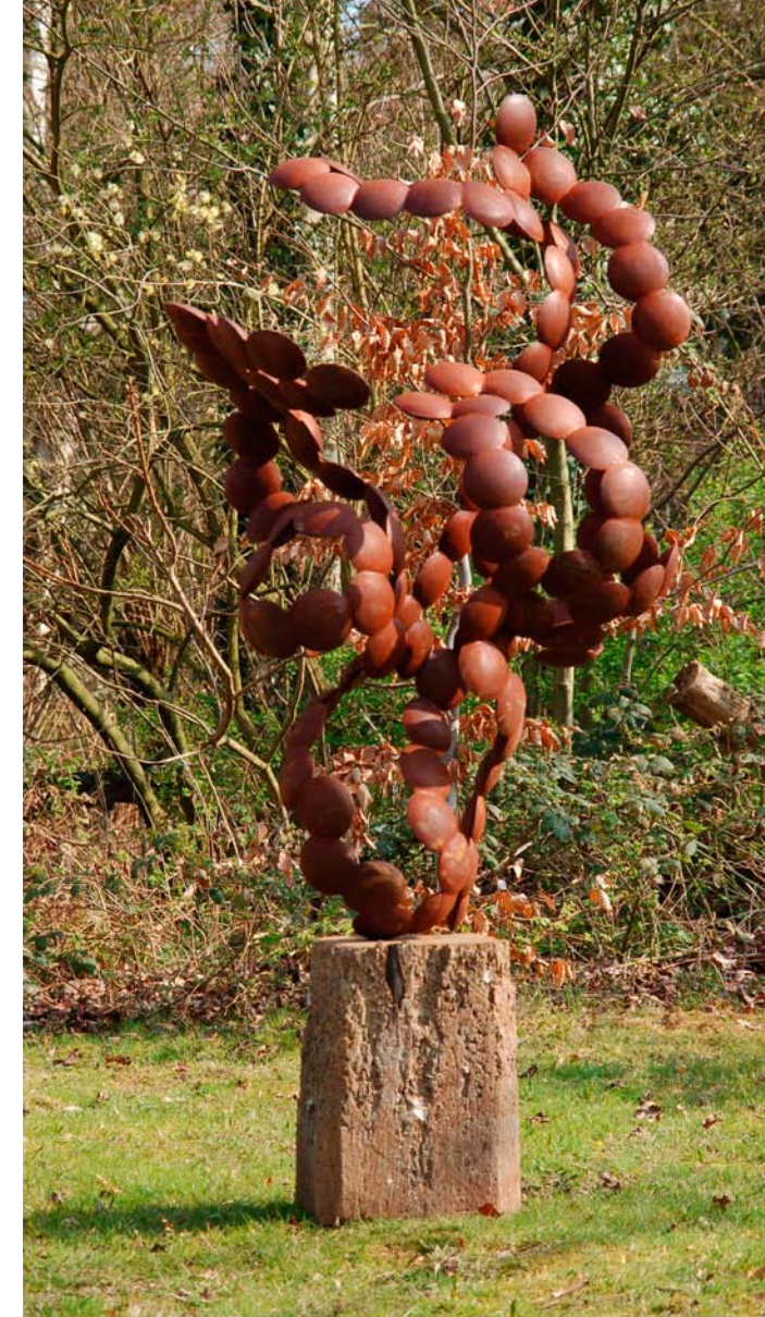
CUMULONIMBUS, 2010 Cortenstaal, hardhout, 208 x 120 x 80 cm