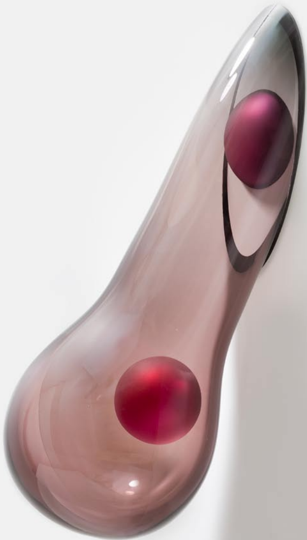
CAUGHT!, 2011 wandobject, 70 cm hoog