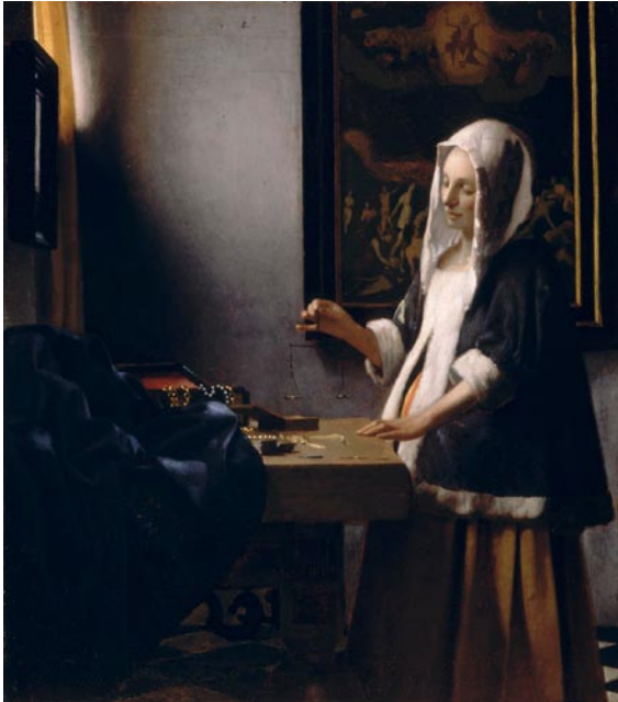
VROUW MET WEEGSCHAAL