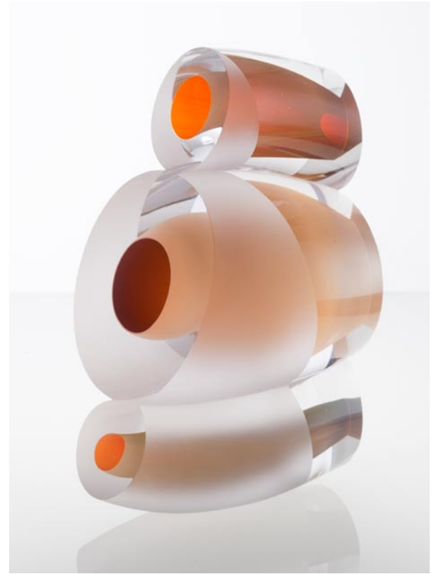
DYNAMIC BALANCE, 2011 32 cm hoog