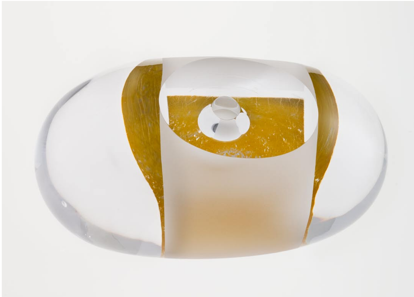
THE ALCHEMIST, 2010 32 cm breed