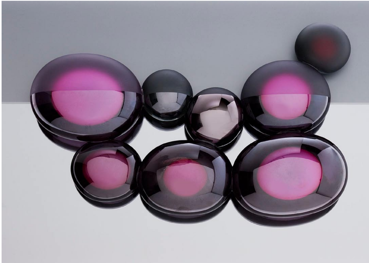
SELF REFLECTION, 2008 45 cm breed