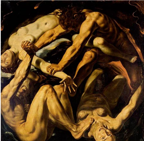
ALLEGORIE OP DE VIER ELEMENTEN