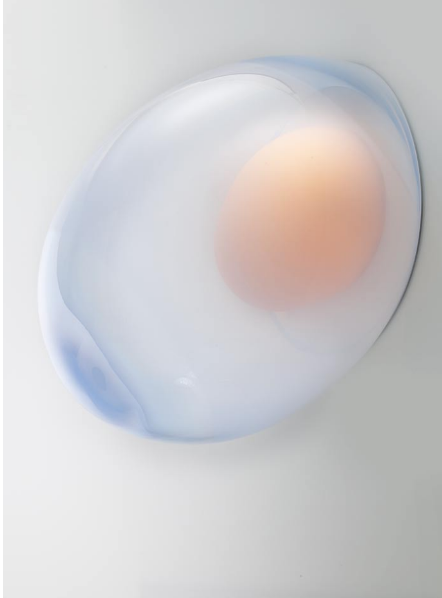
WHEN I'M PREGNANT, 2011 wandobject, 55 cm hoog