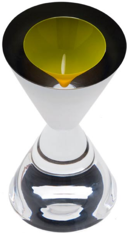
WEIGHTLESSNESS, 2004 27 cm hoog