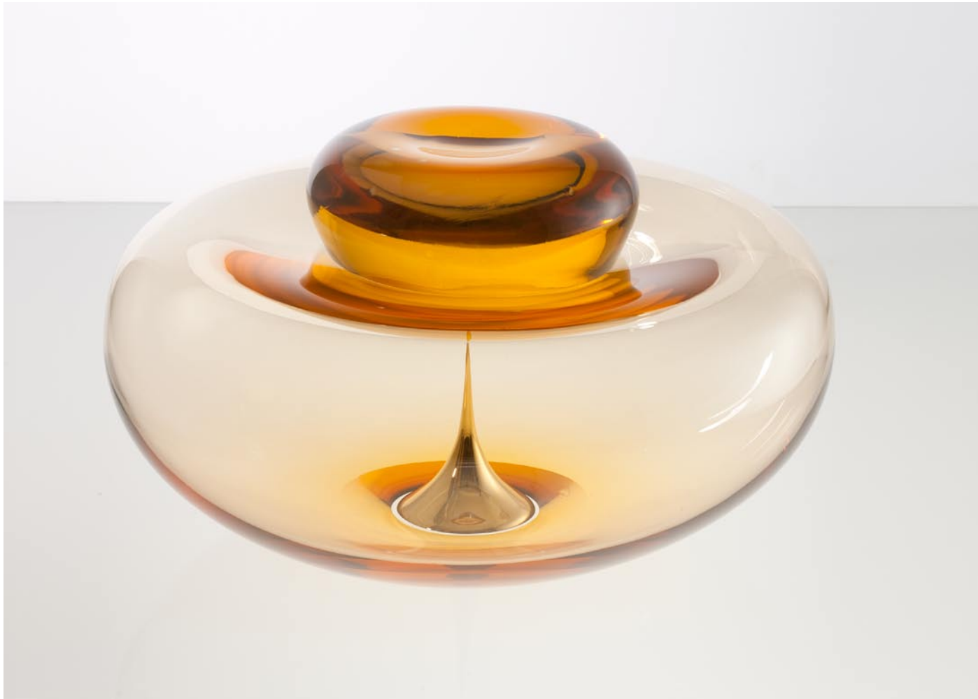
LIQUID LIGHT, 2011 60 cm breed